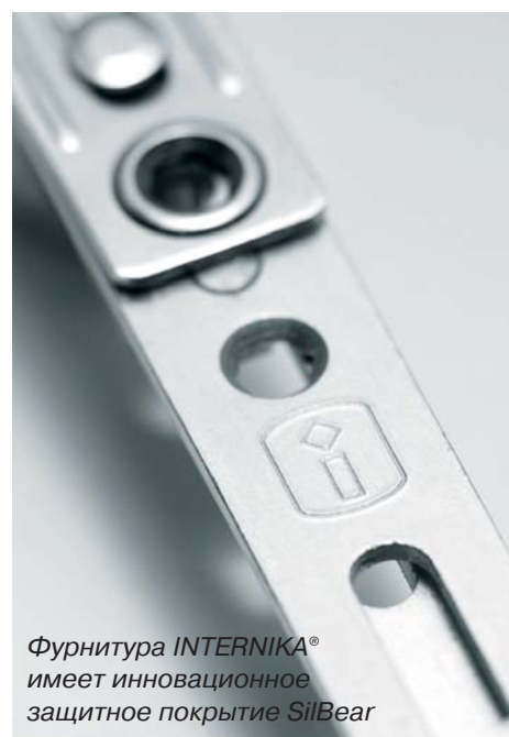
Фурнитура INTERNIKA® имеет инновационное защитное покрытие SilBear