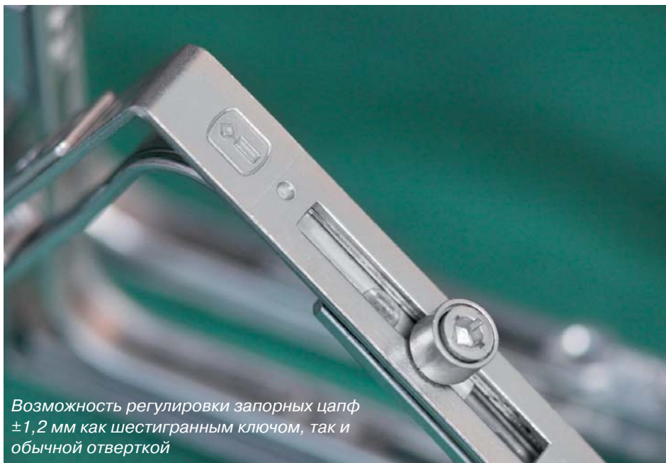
Возможность регулировки запорных цапф \pm 1,2 мм как шестигранным ключом, так и обычной отверткой