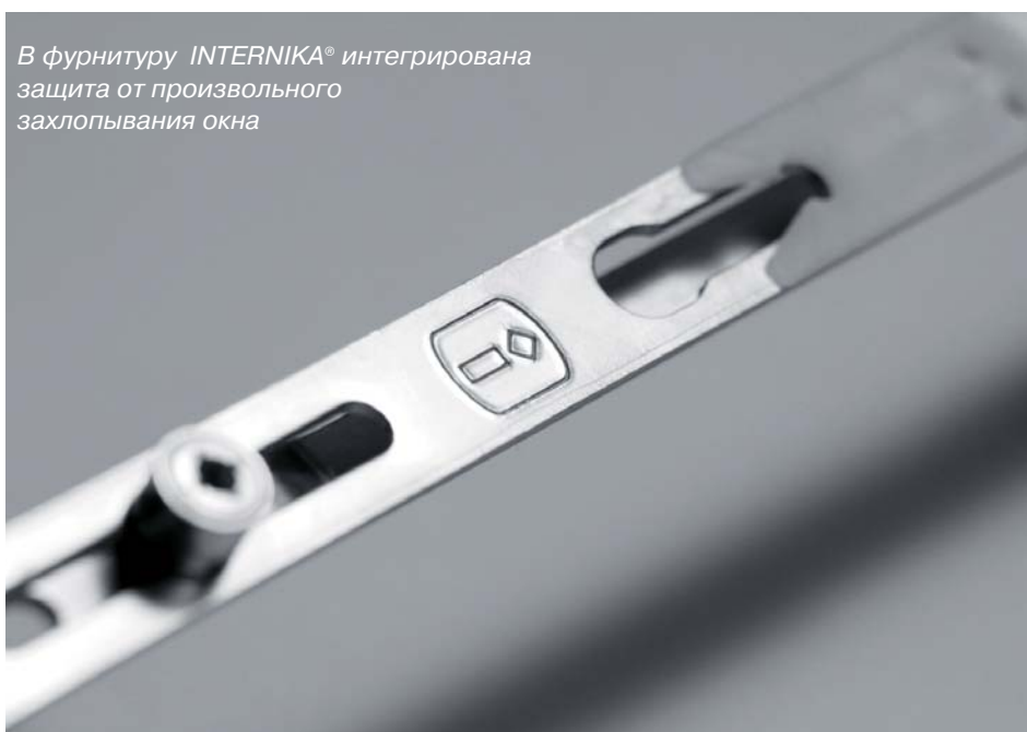
В фурнитуру INTERNIKA® интегрирована защита от произвольного захлопывания окна

Компания ТБМ 141006, Московская обл., г. Мытищи, Волковское шоссе, вл. 15 Тел.: +7 (495) 380-1827, 380-1828 Internika.tbm.ru