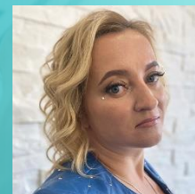
Редакторская группа, дизайн