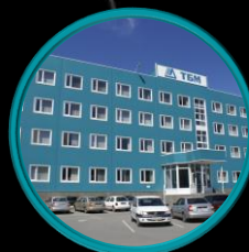
Rostow am Don