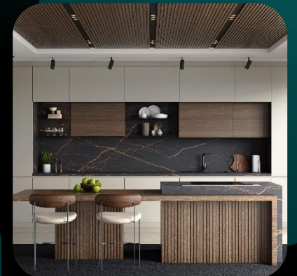
Bestandteile für Möbel