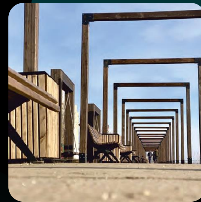
Lackmaterialien und Klebstoffe