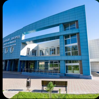
Komplettlösungen für Aluminium-Fassaden