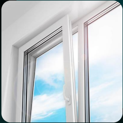
Bestandteile für Fenster