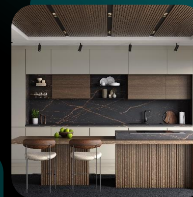
Комплектующие для мебели