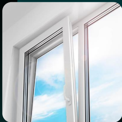
Комплектующие для окон