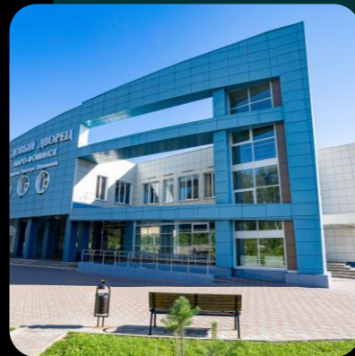
Комплексные решения для алюминиевых фасадов